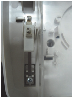
Vite del tamper