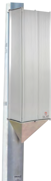
PM 721 x 160 x 220 mm