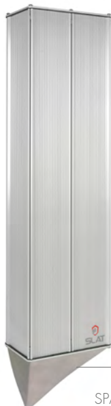
SPACE BOX 921 x 160 x 220 mm