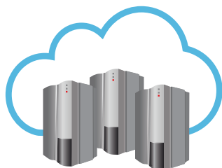
Serveur RISCO Cloud

La ProSYS™ Plus a été conçue en prenant en compte le fait qu'une communication fiable est cruciale pour les installations professionnelles. Elle ne vous fournit pas uniquement les dernières technologies de communications disponibles comme l'IP multi-socket, le 3G et le WiFi, mais elle supporte aussi la configuration multicanaux pour assurer la redondance complète de la communication.