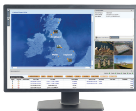
Système de Gestion