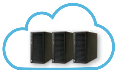
Serveur RISCO Cloud